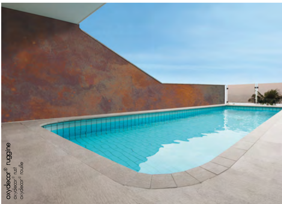
oxydecor® ruggine oxydecor® rust oxydecor® rouille