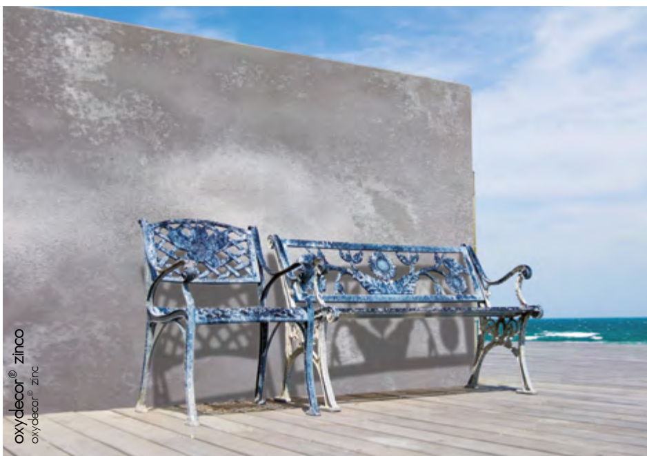
oxydecor® zinco oxydecor® zinc

Grâce à sa facilité d'application, résistance à l'usure, aux intempéries, à la corrosion du sel et aux rayures, Oxydecor® Isoplam®, se distingue parmi les solutions décoratives faciles à proposer. Capable de reproduire l'effet galvanisé du Corten naturel sur n'importe quel support, la peinture OXYRUST & OXYZINC, est appréciée par les plus importants designers et architectes, ainsi que par les marques de différents