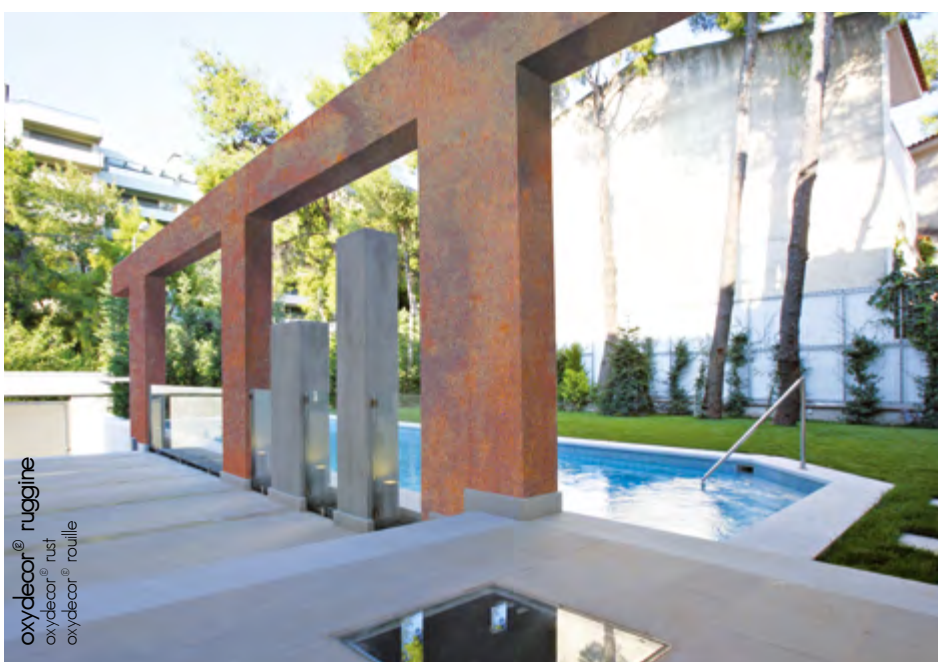
oxydecor® ruggine oxydecor® rust oxydecor® rouille