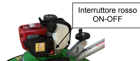
Interruttore rosso ON-OFF